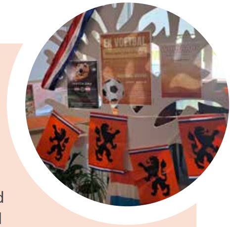
Team welzijn Bachten Dieke

Bachten Dieke stond in het teken van het EK! De brasserie was het mooi versierd. Er stond een oranjeboom waarop iedereen de einduitslag van elke wedstrijd van Nederland kon voorspellen. Bij elke wedstrijd zat er een winnaar. Bij 1 wedstrijd was de einduitslag wel 9x goed voorspeld! Het leukste is natuurlijk om de wedstrijden gezamenlijk te kijken wat ook werd gedaan! De bewoners hebben onder genot van hapje en drankje het Nederlands Elftal aangemoedigd. Met dank aan de medewerkers van de brasserie en alle hulp van vrijwilligers.