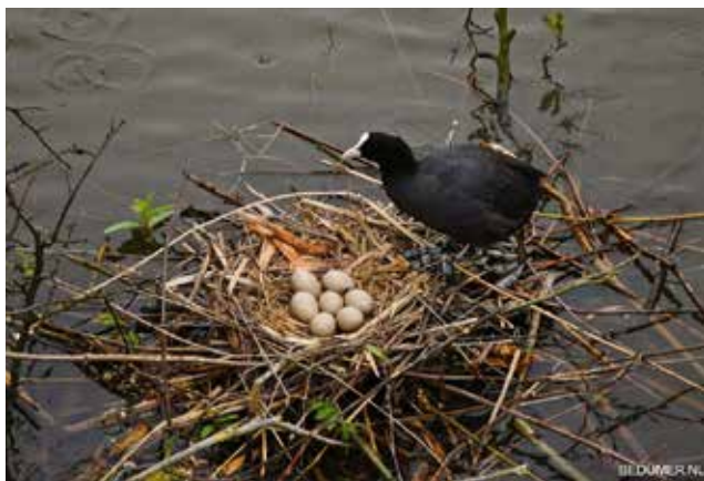
Meerkoet op nest

Veel vogelsoorten broeden hun eieren uit in afgesloten ruimtes, hopen of gangen. Sommige, zoals de uil, de mees en de papegaai, nestelen in bestaande holtes, terwijl andere hun eigen hol uitgraven. Nesten bouwen is hard werken. Vandaar dat het nestmateriaal van het volgende jaar vaak wordt hergebruikt voor een ander nest. Sommige vogels, zoals de hamerkop en de meeste roofvogels, gaan economisch te werk en hergebruiken hun nesten.