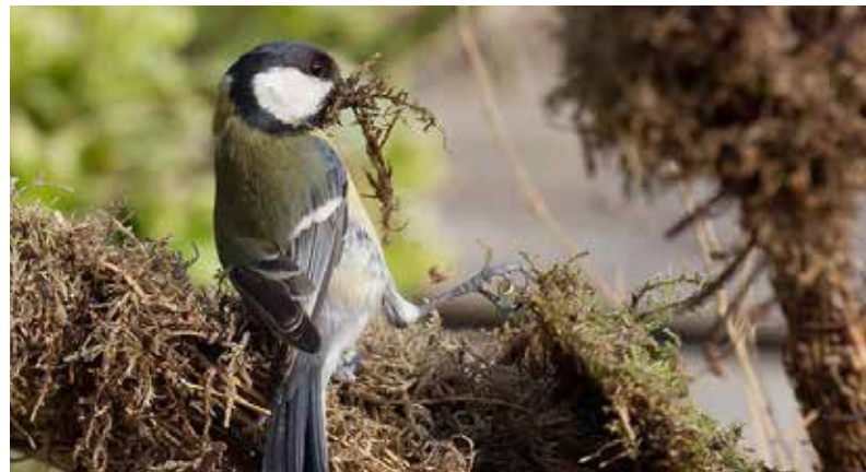
Meesje met mos